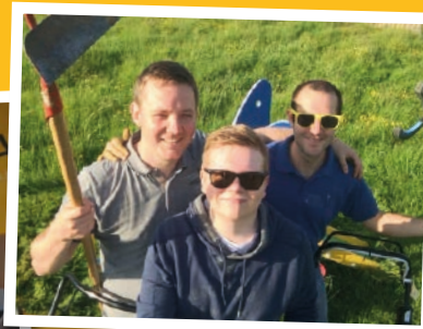
Jong N-VA steekt zelf de handen uit de mouwen om onze stad mooier te maken.