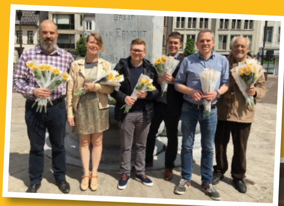
Een bloemetje voor alle moeders in Zottegem.