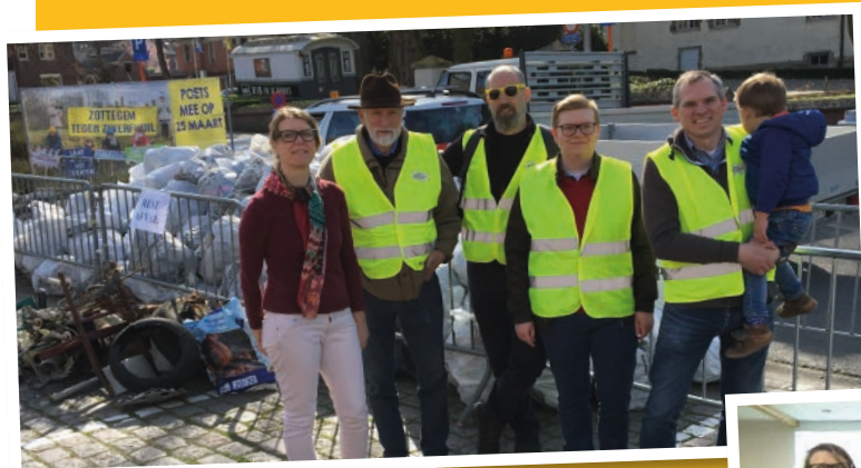
N-VA Zottegem neemt deel aan de zwerfvuilactie.