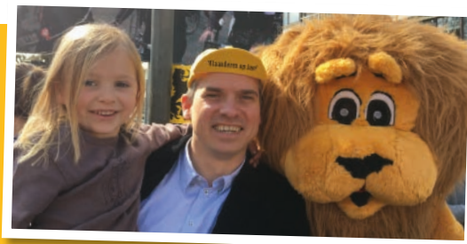
Vlaanderens mooiste wordt ook door N-VA Zottegem begroet in onze Egmontstad.