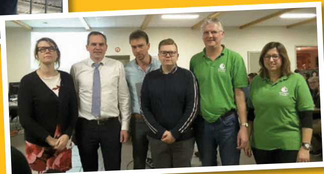
N-VA Zottegem wint de quiz van de gezinsbond.