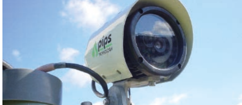
Camera's zorgen voor meer veiligheid p. 2