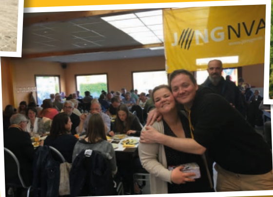
Super geslaagd eerste eetfestijn van jong N-VA Zottegem.