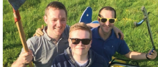
N-VA-Zap in beeld p. 3